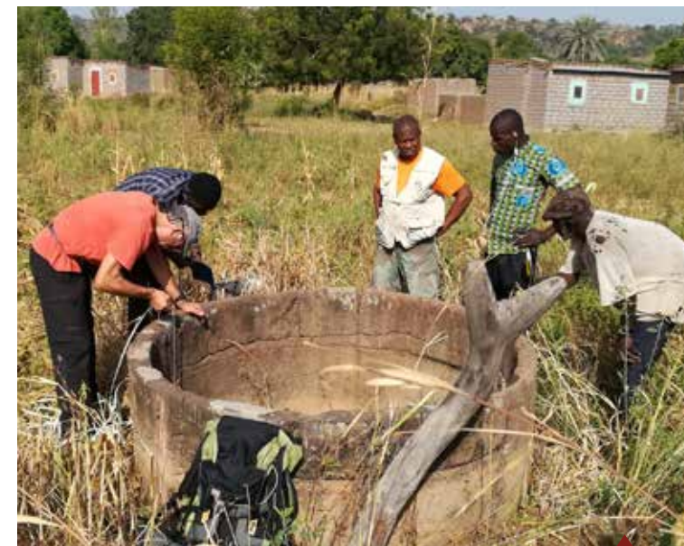
◀ Etude autour d'un puit