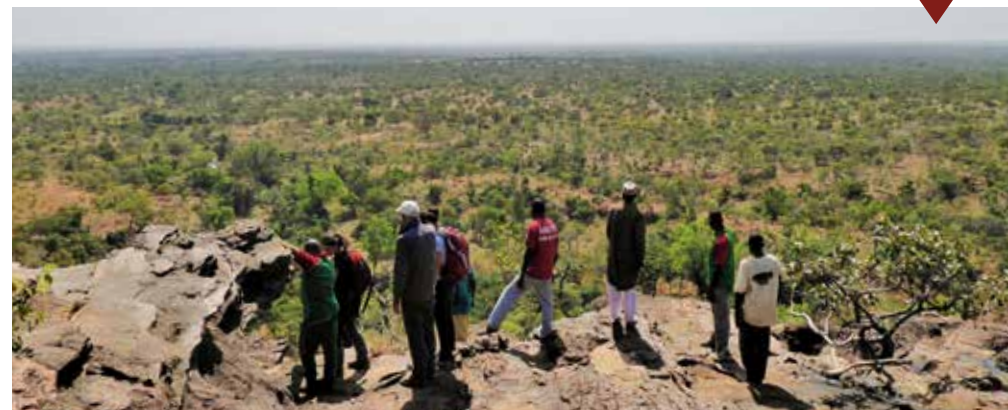
◀ Balade sur les falaises