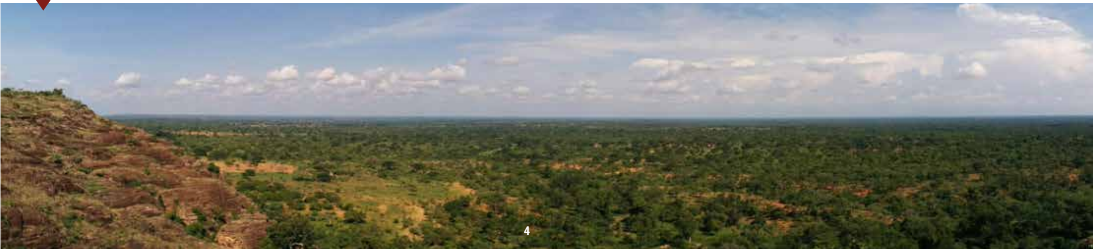
Panoramique des falaises

En mai 2018, l'Agence Française de Développement a octroyé un co-financement à hauteur de 325 500 € pour la mise en œuvre du projet « Un Avenir au Pays des Falaises ». Ce projet a également obtenu l'appui de la Région Auvergne Rhône Alpes. Ce programme de développement rural est mené par les associations AFRAT, Kuru Kofé et Tétraktys, dans la zone des falaises de la région des Hauts-Bassins et des Cascades au Burkina Faso. Le patrimoine des Falaises est au cœur de ce programme comme vecteur de développement économique, de lien social et de gouvernance territoriale . La protection et la valorisation des patrimoines sont ici conçues comme le socle de la promotion économique et sociale des communautés locales . Le projet a débuté le 1er novembre 2018 pour une durée de 3 ans.