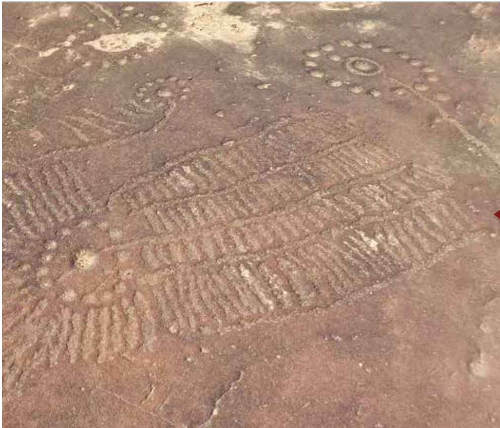
Gravure rupestre sur les falaises de Wempea