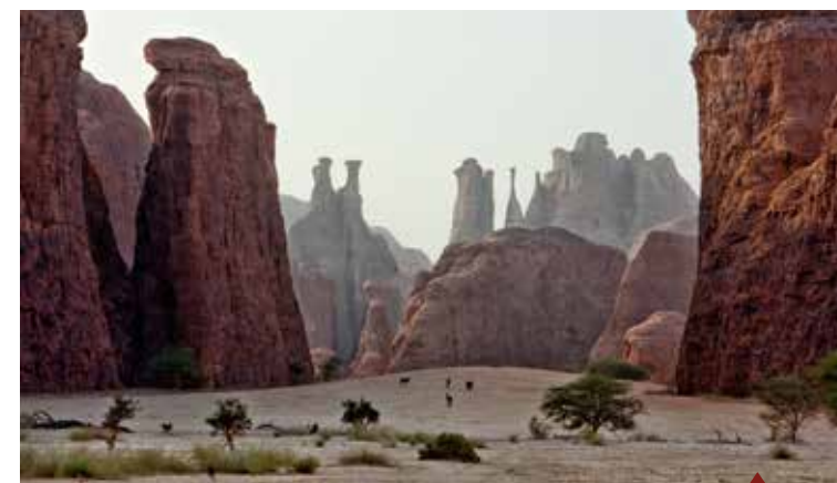
Cheminées de fées dans l'Ennedi

En 2019, une mission conjointe de l'ONPTA, La Saharienne, Point Voyages et Tétraktys visera à définir un plan d'actions prioritaires.