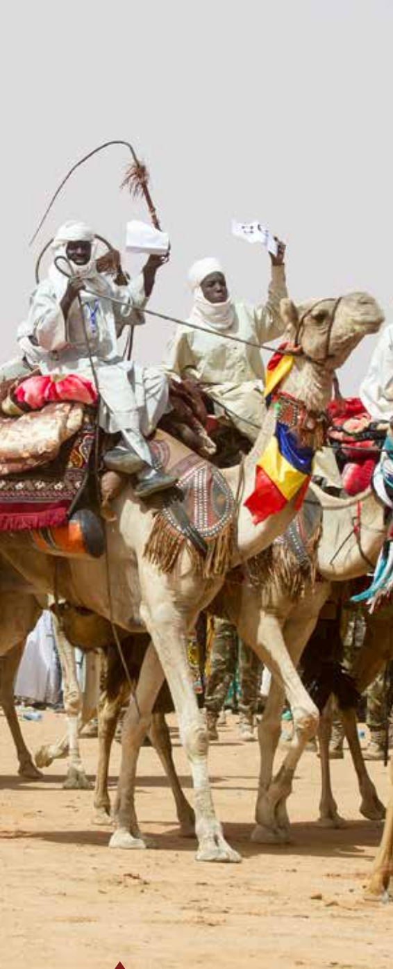
Le festival des cultures sahariennes