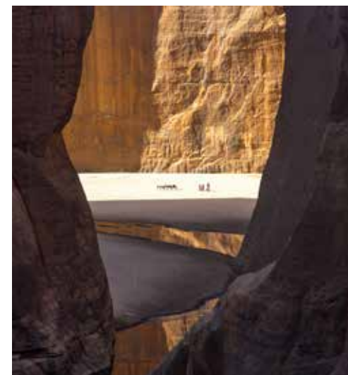
La guelta d'Archei