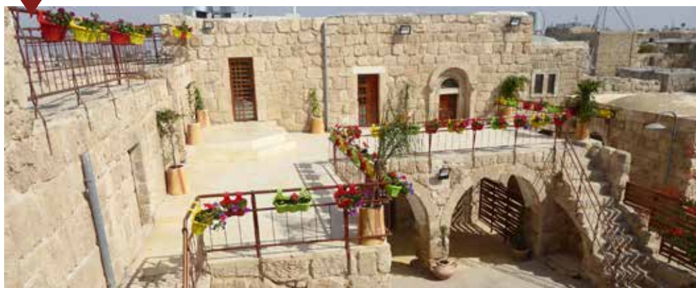
► Un nouvel hébergement

2 missions ————— 1 délégation en France ————— 1 reconnaissance internationale —————