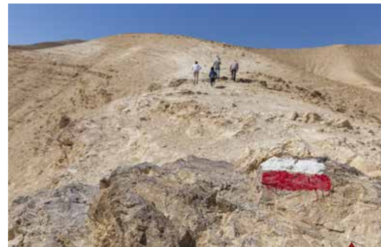
Balisage du Sentier

En 2018, le Sentier d'Abraham a bénéficié d'une visibilité et d'une reconnaissance internationales ! Le travail de structuration et d'accompagnement des acteurs locaux portent ses fruits puisque le Sentier a été nommé Trek de l'année 2018 et apparait désormais dans le Routard. La fréquentation est en hausse et de nouveaux produits se structurent le long de l'itinéraire : le Sentier d'Abraham à VTT , le Sentier avec ânes bâtés ou encore la découverte d'un sentier gastronomique . Mais ce n'est pas tout : le Sentier s'agrandit aussi ! De nouvelles étapes seront bientôt prêtes à parcourir : une au Nord à Kafr Malek, 3 au Sud jusqu'à Beit Mirsim et une vers Jérusalem.