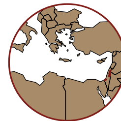
Masar Ibrahim - Sentier d'Abraham