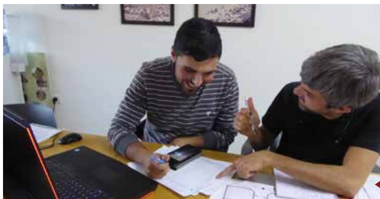
► Réunion entre Tetraktys et l'ingénieur palestinien