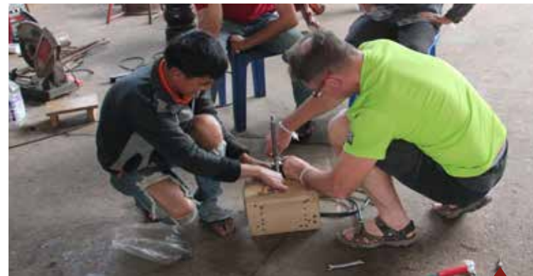
Construction des lampes écologiques